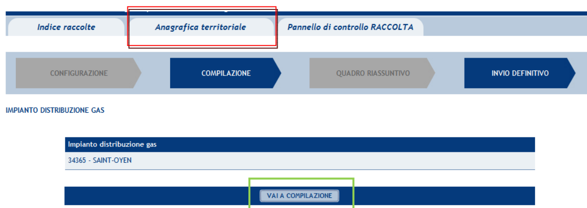
Figura 1.5: Riepilogo

Selezionando il tasto “Riepilogo” si accede all’elenco degli impianti di distribuzione gas gestiti dal distributore alla data 30 settembre 2010. Le eventuali modifiche all’assetto impiantistico possono essere effettuate unicamente attraverso l’Anagrafica territoriale , cui si accede attraverso il bottone “Anagrafica territoriale” (rettangolo rosso in figura 1.4). In seguito all’apertura dell’Anagrafica territoriale non è infatti più prevista la possibilità di modificare il l’assetto impiantistico attraverso una fase di “Configurazione” interna alla raccolta, la freccia “Configurazione” appare pertanto disabilitata.