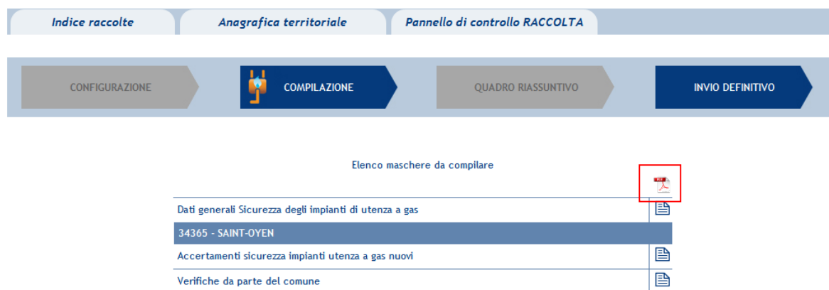
Figura 2.1: Elenco maschere da compilare

Come inizio della fase di compilazione, verrà visualizzato un elenco delle maschere da compilare (figura 2.1).