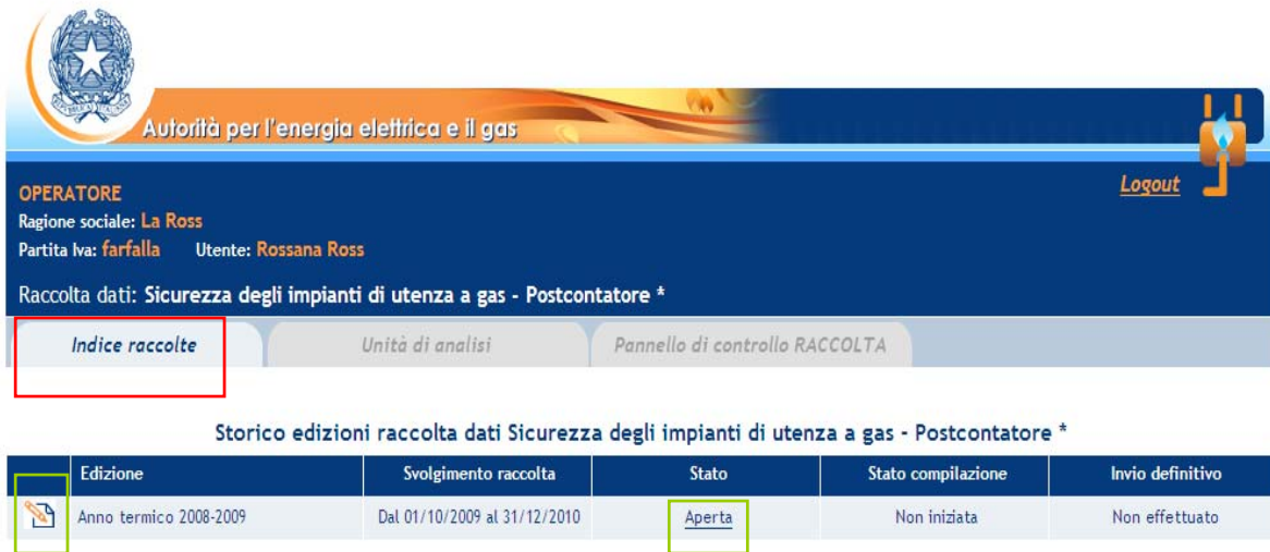
Figura 1.3: Storico della raccolta

Accedendo alla raccolta viene visualizzata la pagina “Pannello di controllo” (figura 1.4), dove è presente la voce “Impianto distribuzione gas”.