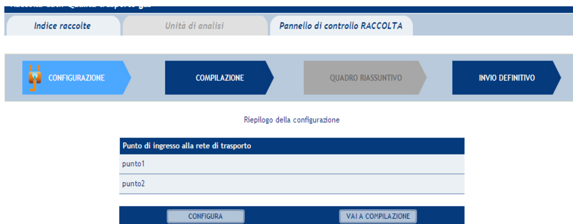
Figura 3.1: Riepilogo della configurazione

Premendo il pulsante “VAI A COMPILAZIONE”, invece, si passerà alla fase di compilazione.