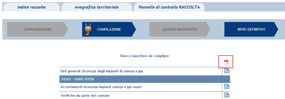
Figura 2.1: Elenco maschere da compilare

Come inizio della fase di compilazione, verrà visualizzato un elenco delle maschere da compilare (figura 2.1).