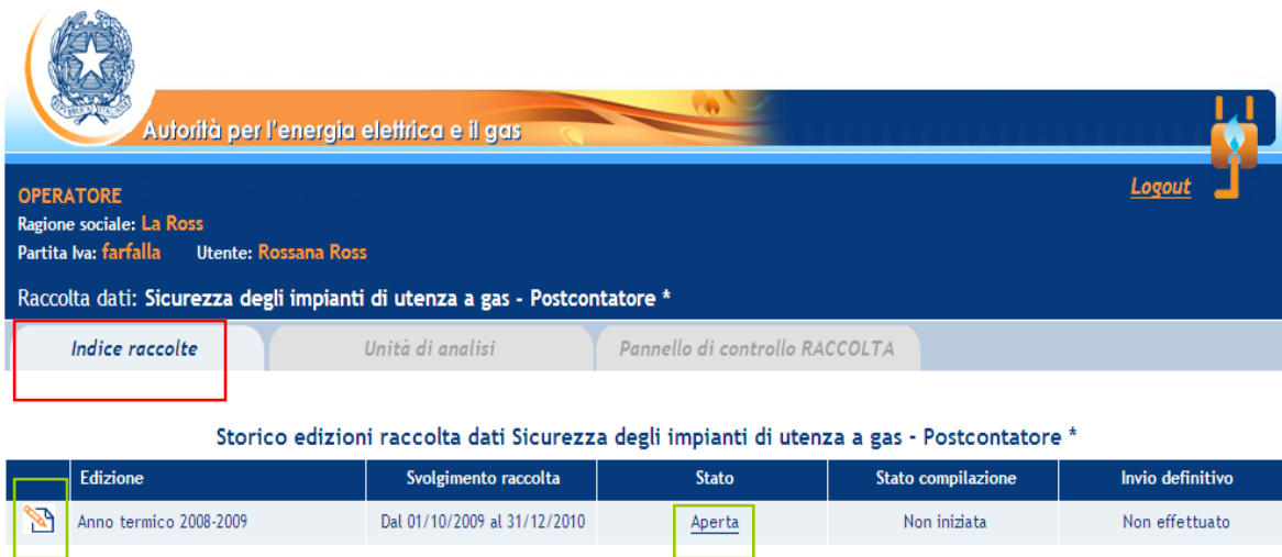
Figura 1.3: Storico della raccolta

Accedendo alla raccolta viene visualizzata la pagina “Pannello di controllo” (figura 1.4), dove è presente la voce “Impianto distribuzione gas”.