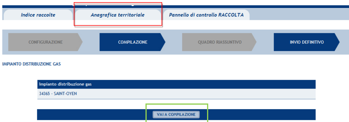
Figura 1.5: Riepilogo

Selezionando il tasto “Riepilogo” si accede all’elenco degli impianti di distribuzione gas gestiti dal distributore alla data 30 settembre 2013. Le eventuali modifiche all’assetto impiantistico possono essere effettuate unicamente attraverso l’Anagrafica territoriale , cui si accede attraverso il bottone “Anagrafica territoriale” (rettangolo rosso in figura 1.4). In seguito all’apertura dell’Anagrafica territoriale non è infatti più prevista la possibilità di modificare il l’assetto impiantistico attraverso una fase di “Configurazione” interna alla raccolta, la freccia “Configurazione” appare pertanto disabilitata.