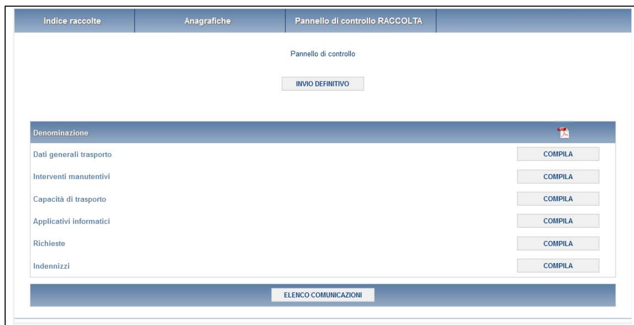
Figura 2.1: Pannello di controllo della raccolta

Accedendo alla raccolta viene visualizzata la pagina Pannello di controllo (figura 2.1) dove sono presenti tutte le voci inerenti a questa raccolta.