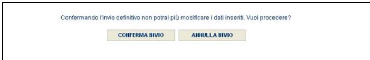
Figura 3.6.1: Invio definitivo

ATTENZIONE: Per effettuare l'invio dei dati è necessario aver compilato totalmente la raccolta dati.