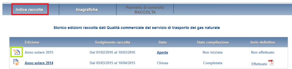
Figura 1.2: Storico della raccolta dati