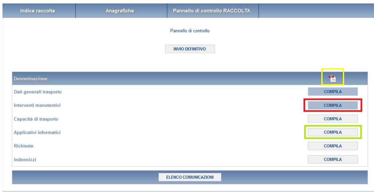
Figura 2.2: Pannello di controllo della raccolta con maschera salvata

Nella schermata “Pannello di controllo” è sempre possibile, selezionando l'apposita icona, visualizzare e salvare il pdf contenente tutte le schede con i dati aggiornati all'ultimo salvataggio (rettangolo giallo in figura 2.2).