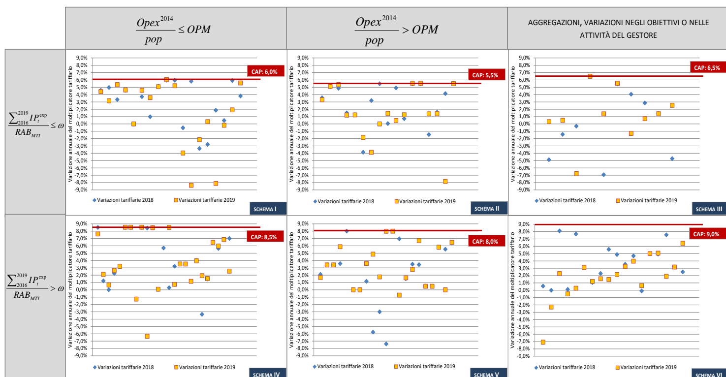
TAV. 1 – Distribuzione delle variazioni tariffarie (anni 2018 e 2019) nell’ambito della matrice di schemi regolatori

2.7 Si sottolinea come 38 gestori (di cui 7 con vincolo di prezzo attivo) si collochino nello Schema II (17 gestioni) e nello Schema V (21 gestioni), caratterizzandosi per un valore pro capite della componente Opex^{2014} superiore all’ Opex pro capite medio (OPM) stimato dall’Autorità per l’intero settore. In tali casi, le verifiche in ordine alla sostenibilità degli effetti della revisione dei programmi degli interventi, alla luce dell’applicazione della regolazione della qualità tecnica, saranno presumibilmente focalizzate sul contenimento dei costi operativi.