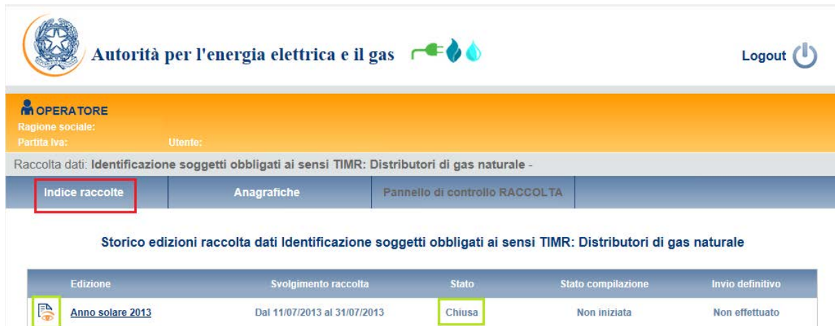
Figura 1.2: Storico della raccolta