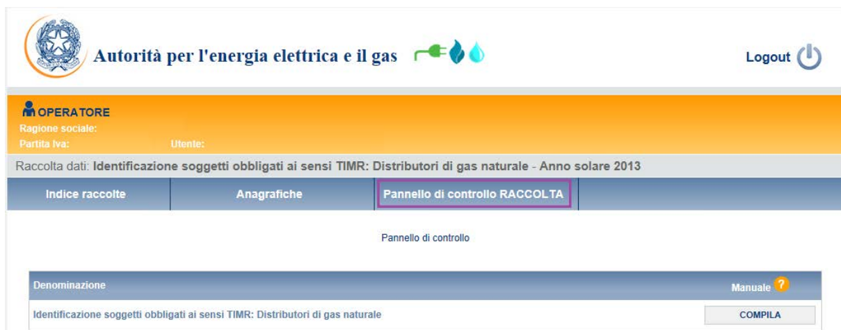
Figura 2.1: Pannello di controllo della raccolta

Accedendo alla raccolta viene visualizzata la pagina Pannello di controllo (figura 2.1) dove sono presenti tutte le voci inerenti a questa raccolta.