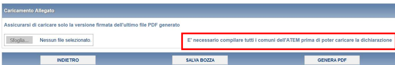
Figura 3.5: messaggio in caso non siano stati compilati tutti i Comuni

L’invio della presente maschera è possibile solo dopo aver compilato tutte le maschere per tutti i Comuni associati all’ambito stesso (riquadro rosso in figura 3.5).