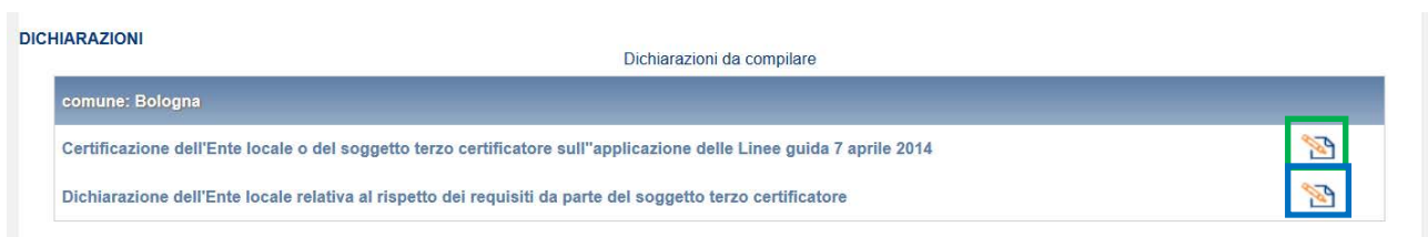
Figura 3.1: elenco maschere da compilare per Comune

Per accedere alla compilazione è necessario premere, dal pannello di controllo (Figura 1.3), il pulsante “COMPILA” situato in corrispondenza di ogni Comune (figura 3.1).