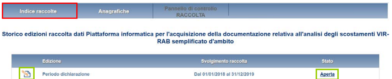
Figura 1.2: storico della raccolta

Accedendo alla raccolta viene visualizzata la pagina “Pannello di controllo” (Figura 1.3), dove è presente l'elenco dei Comuni appartenenti agli ambiti identificati in fase di accreditamento della stazione appaltante ai fini dell'acquisizione dei dati RAB, secondo quanto previsto dalla determinazione del Direttore della Direzione Infrastrutture Unbundling e Certificazione dell'Autorità 14 marzo 2014, n. 5.