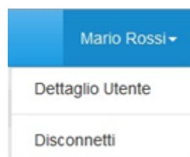
Figura 1.3: sezione utente

Nel riquadro verde della Figura 1.2 sono mostrati nome e cognome della persona che ha effettuato l'accesso al sistema. Tale voce consente di disconnettersi dal sistema attraverso il tasto Disconnetti o di visualizzare, tramite il tasto Dettaglio Utente (Figura 1.3), le informazioni dell'operatore (Figura 1.4).