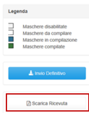
Figura 2.4: link ricevuta invio definitivo

ATTENZIONE: ad invio definitivo effettuato le maschere e la configurazione non sono più modificabili. Ulteriori modifiche che si rendessero necessarie successivamente, potranno avvenire solo richiedendo una rettifica agli uffici dell'Autorità.