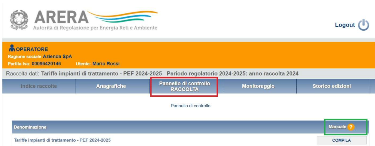
Figura 3.1: pannello di controllo

Nel Pannello di controllo, come nel resto del sistema, è presente il bottone per poter tornare all' Indice delle raccolte . Inoltre, da qualunque punto del sistema è sempre possibile tornare a questa pagina cliccando il pulsante " Pannello di controllo RACCOLTA " (rettangolo rosso in figura 3.1).