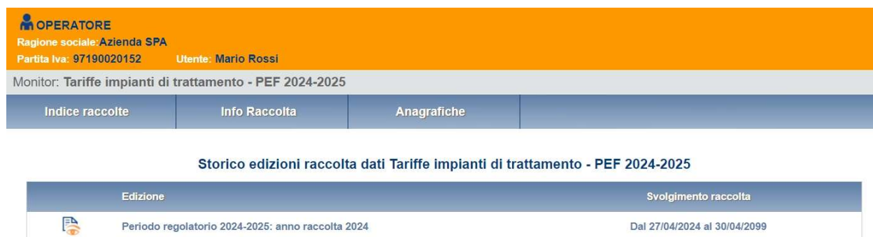
Figura 2.2: storico della raccolta